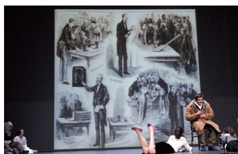
Figura 7. Humphry Davy explica el origen de la electroquímica en una de sus multitudinarias conferencias en el Memory Hall de la Royal Institution de Londres ante la atenta mirada de dos admiradoras.