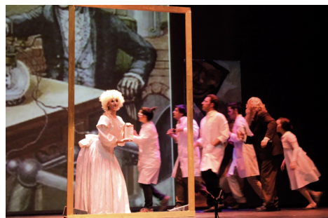
Figura 6. En un museo, Marie Anne Pierrette Paulze de Lavoisier se dirige al público desde un cuadro y cuenta los trabajos llevados a cabo junto a su marido Antoine.