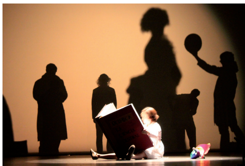
Figura 2. La protagonista de la historia estudia los elementos químicos antes de dormirse.