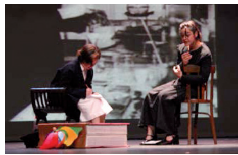
Figura 9. Ève Curie escribe la biografía de su madre. Marie recuerda cómo conoció a su marido Pierre, se inició en la investigación con él y descubrió los elementos polonio y radio. 19