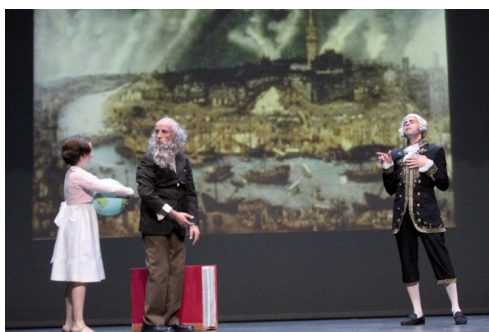
Figura 4. El investigador sevillano Antonio de Ulloa cuenta sus aventuras por América meridional y el descubrimiento del metal platino.