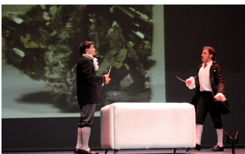
Figura 5. Los hermanos Delhuyar, firman el trabajo donde describen el aislamiento de un nuevo metal, el wolframio, a partir del mineral wolframita.