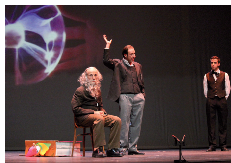
Figura 8. Sir William Ramsay explica el descubrimiento de los primeros gases nobles en presencia de Mendeléiev y Lothar von Meyer.