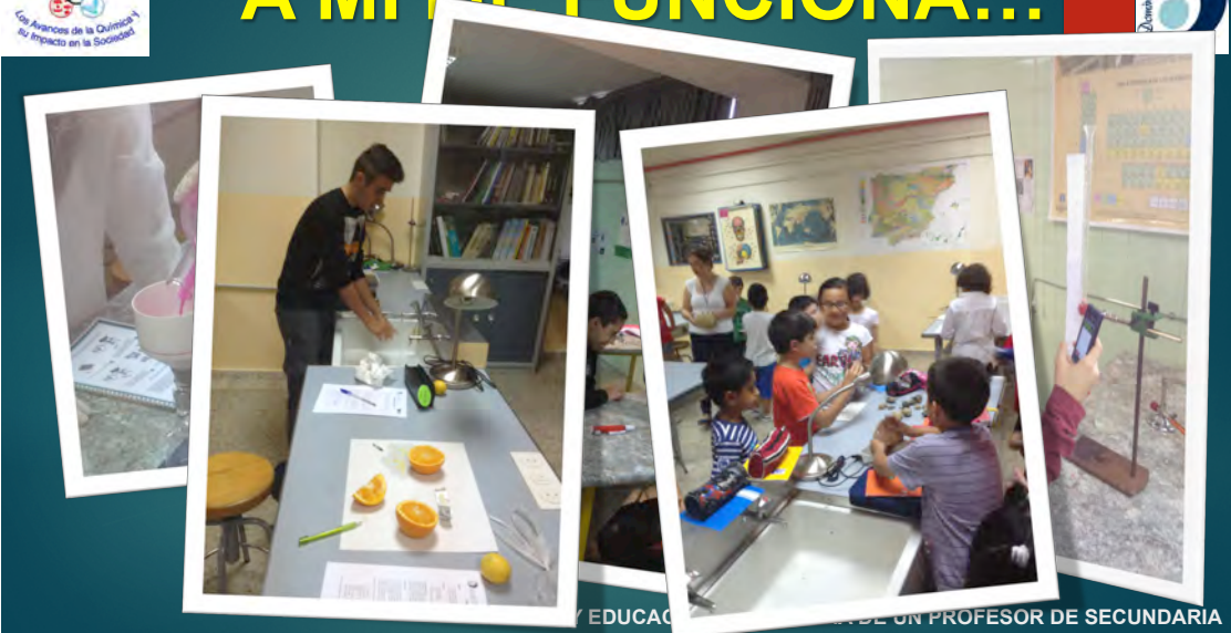
CIENCIA Y EDUCACIÓN: EL DÍA A DÍA DE UN PROFESOR DE SECUNDARIA